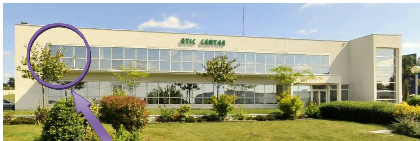
Nos locaux sont situés au 1 er étage*.

Centre d'affaires Etic Center (1 er étage) 9 rue des Charmilles 35510 Cesson Sévigné Téléphone : 02.90.22.84.22